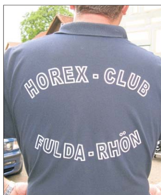
Das Club-T-Shirt trägt man natürlich mit Stolz.