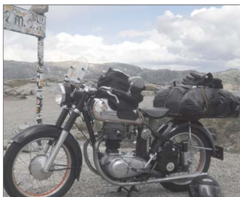
Die vollbepackte Regina, meistgebaute Horex, auf einer Passhöhe in Höhe von 932 Metern im Hochland Richtung Lysefjord.